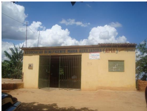
Figura 1: Associação Beneficente de artesões de Machados-PE.