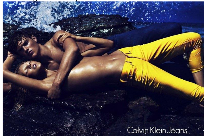
Figura 4: Campanha Calvin Klein Jeans 2012