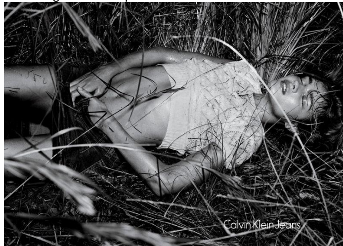
Figura 3: Campanha Calvin Klein Jeans 2005.