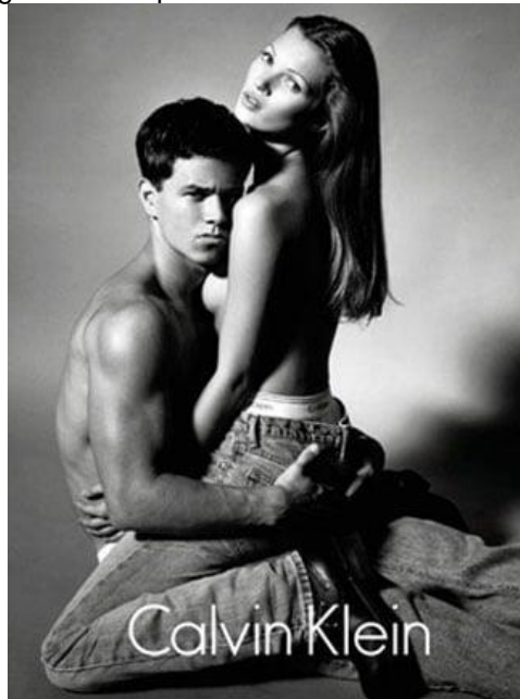
Figura 1: Campanha Calvin Klein Jeans 1992.