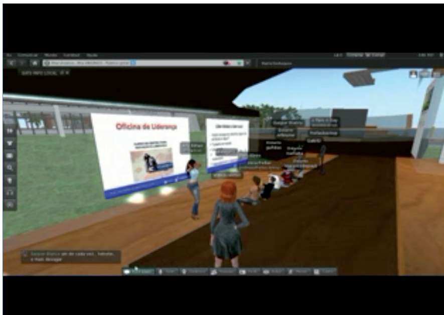
FIGURA 3 – Sala de Reunião Virtual