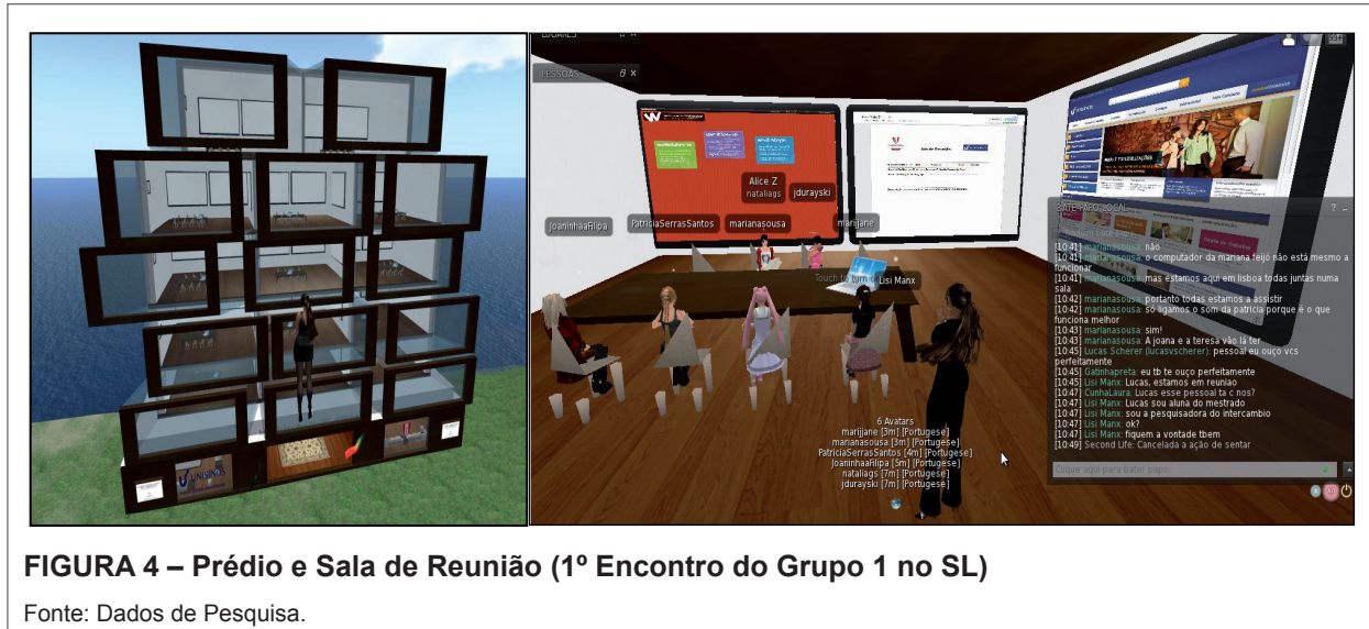
FIGURA 4 – Prédio e Sala de Reunião (1º Encontro do Grupo 1 no SL)