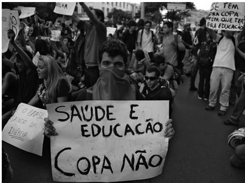
FIGURA 2 – Foto das manifestações de junho de 2013.

As manifestações de junho de 2013 em diversas regiões do Brasil também não poderiam deixar de ser citadas. Os protestos começaram em São Paulo. Centenas de jovens se articularam pelas redes sociais para protestar contra o aumento de R$ 0,20 no valor da passagem de ônibus. Do virtual para o real, a juventude ganhou as ruas não somente de São Paulo como nas de várias capitais do país, para exigir melhoria na qualidade de vida, com transporte público, saúde e educação decentes.