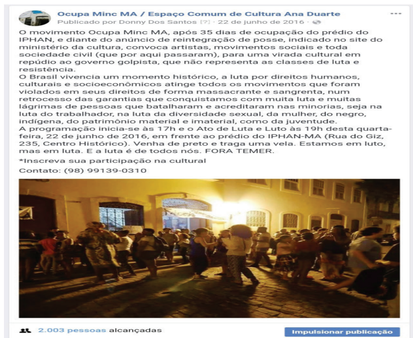
Figura 5 – Chamada do movimento diante da possibilidade de reintegração de posse do prédio após 35 dias de ocupação.