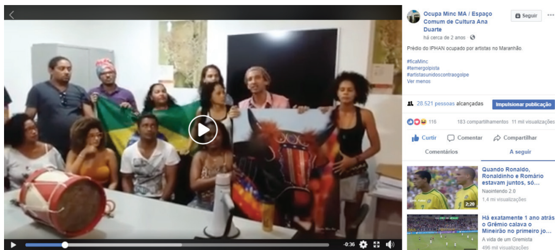
Figura 3 – Primeiro ato de ocupação no Prédio do IPHAN-MA.

Os primeiros dias foram intensos. Muitas assembleias, muitas aulas públicas, oficinas artísticas, shows musicais, desfiles de moda, exibição de filmes, dentre outras atividades. Pode-se observar no primeiro vídeo publicado na página do Facebook (Figura 3) obteve um alcance de quase 30.000 pessoas de todo o Brasil, com mais de 11.000 visualizações e 183 compartilhamentos.