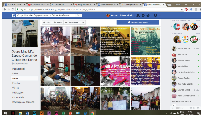
Figura 2 - Articulação virtual que converge para o presencial.

vez mais tênue, não sendo possível que um movimento se delimite unicamente pelo espaço físico, assim como não se desenvolva única e exclusivamente pelo meio virtual. Percebe-se que o caráter híbrido do OcupaMinC-MA vale-se de iniciativas digitais para compor suas iniciativas, mas a ele não se limita. Em sua página oficial (Figura 2) tem-se o cerne do movimento: promover suporte (solicitando recursos, expondo as problemáticas, etc.), realizar chamadas para manifestações presenciais, sensibilizar a sociedade de seus propósitos, divulgar as iniciativas e tornar público e de livre acesso à realidade cotidiana do movimento (CASTELLS, 2013).