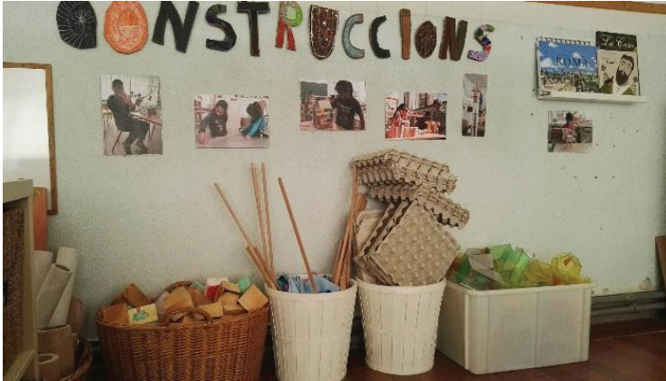
Figura 4- Material de construcciones, Escuela La Tarlatana** (Sabadell)