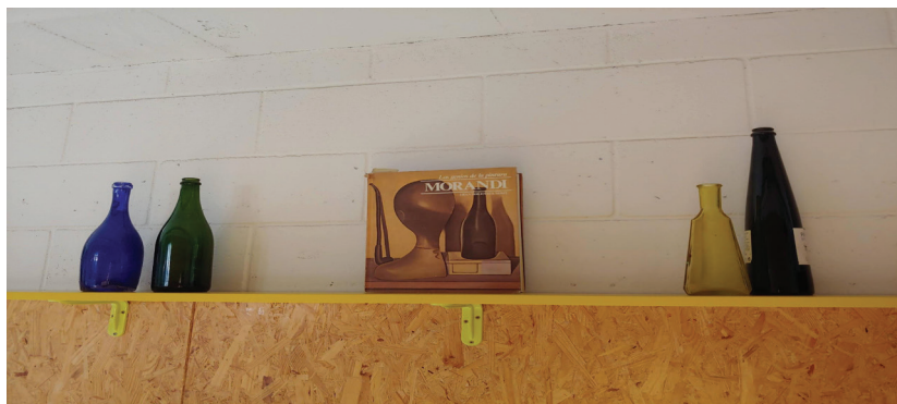
Figura 8- Presentación de un libro de pintura con elementos de bodegones. Escola Nostra Llar (Sabadell)