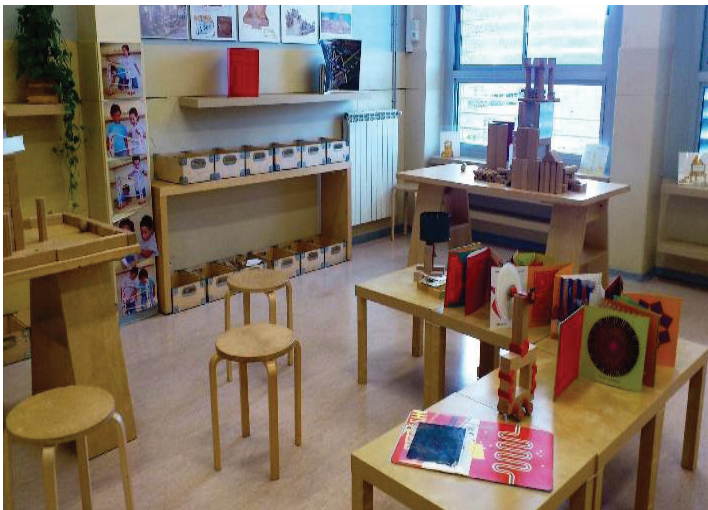
Figura 5- Espacio de construcciones (El Martinet, Ripollet)