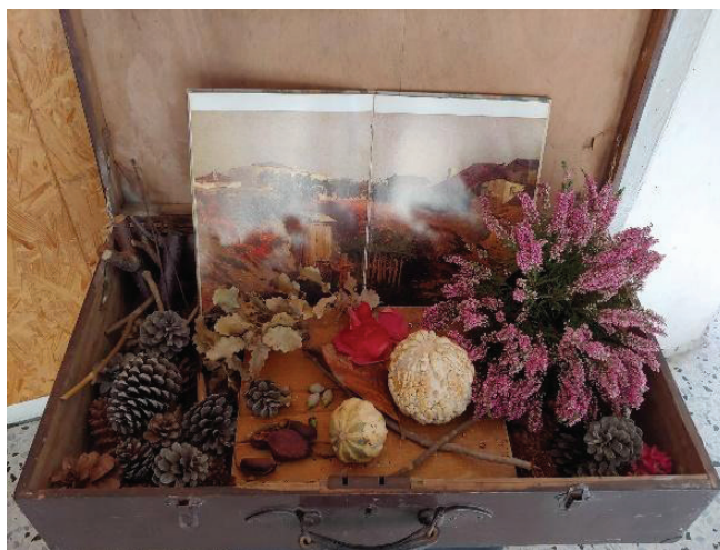
Figura 7- Elementos naturales con libro de pintura. Escola Nostra Llar (Sabadell)