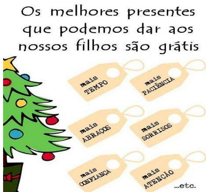
Figura 3: Relacionamentos com filhos