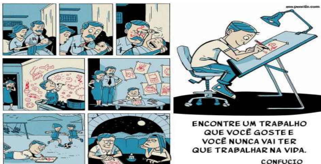
Figura 2: Prazer no trabalho