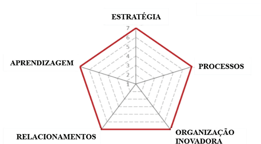
Figura 03 – Auditoria da Inovação