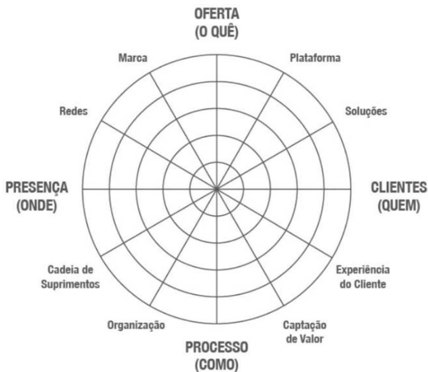
Figura 01 – Radar da Inovação

Fonte: Sawhney, Wolcott e Arroniz (2006)