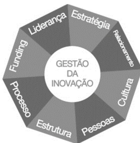
Figura 02 – Octógono da Inovação

Scherer e Carlomagno (2009) propõem uma outra ferramenta denominada “Octógono da Inovação”, a qual permite avaliar o desempenho organizacional sustentado em 08 dimensões da inovação: liderança, estratégia, relacionamento, cultura, pessoas, estrutura, processo e funding (financiamento) (Figura 02).