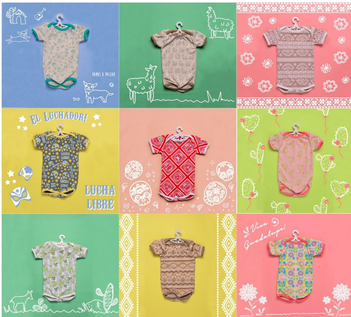
Figura 9 – produção fotográfica dos produtos estampados