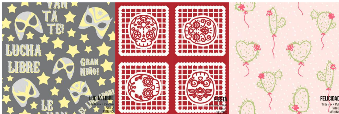
Figura 6 – estampas da fase 2