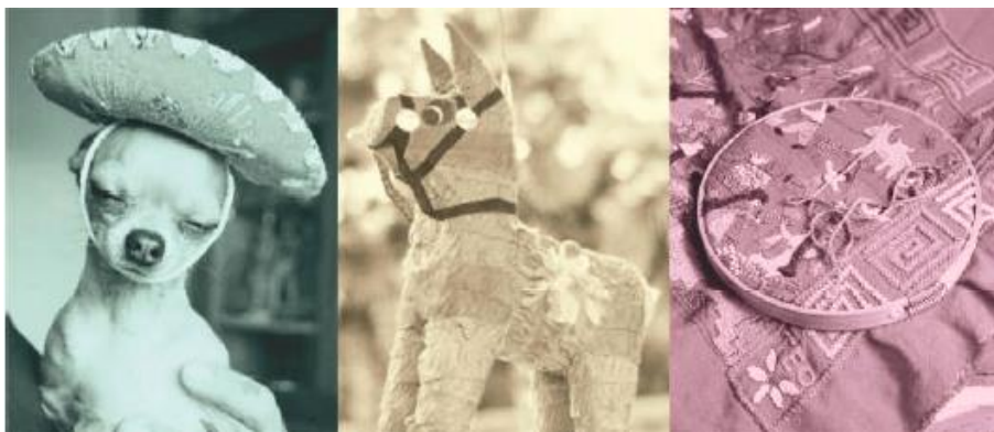
Figura 3 – inspiração para fase 1

A primeira fase corresponde à faixa etária de 0 a 4 meses de idade, quando a criança pouco enxerga e sua pele também é bastante sensível. Sendo assim, texturas muito evidentes e contrastes de cores muito fortes acabam não beneficiando a criança. Dessa forma, foram desenvolvidas para essa fase as estampas Piñata , Chihuahua e Artesania , produzidas pela técnica de serigrafia com tinta mix sem toque. Para essa primeira fase, foi escolhida apenas uma cor de figura que não conflitasse com a cor de fundo. No neutro, a personagem piñata remete a uma brincadeira muito comum no México, na qual crianças vendadas tentam acertar um animal feito de papel para quebrá-lo e pegar os doces em seu interior. Para o segmento feminino a estampa foi inspirada nos bordados manuais e artesanatos tradicionais da região do México. Para os meninos, foi usado o personagem Chihuahua, um cachorro originalmente mexicano. A seguir, o painel de inspiração para primeira fase e estampas desenvolvidas para esse período. (Figuras 3 e 4).