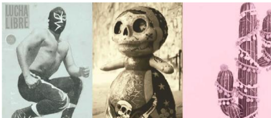
Figura 5 – inspiração para fase 2

elementos de diferentes cores na mesma figura, desde que não sejam criados grandes contrastes de cores. Para essa fase as estampas foram inspiradas em cactos, caveiras mexicanas, e a tradicional lucha libre (Figura 5), resultando nas estampas Fiesta , Lucha Libre e Felicidad (Figura 6). Para a estampa masculina Lucha Libre foram escolhidas duas cores, produzidas com tinta mix, sem toque, porém com acabamento de película termocolante em textura de bolinhas. Na estampa neutra Fiesta foi usada a tinta mix sem toque em conjunto com a tinta puff , que cria um leve relevo, sendo as duas técnicas na mesma cor. E, por fim, para a estampa feminina Felicidad foram escolhidas três cores, sendo duas em tinta mix , e uma em tinta puff .