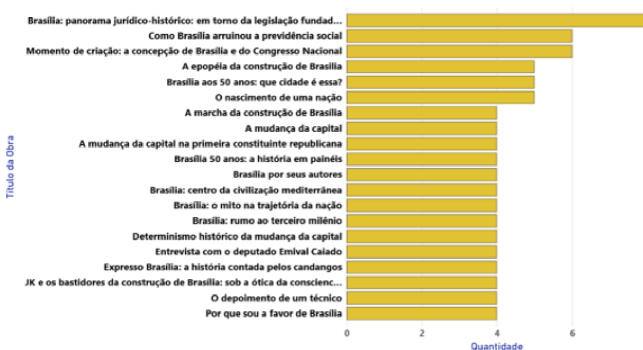
Gráfico 1 – Distribuição dos documentos recorrentes entre as bibliotecas cooperantes da RVBI.

obras se consolidaram como referências centrais para a compreensão da história da capital federal e aparecem em diversas instituições. A presença reiterada desses documentos reflete sua relevância histórica e cultural, ao mesmo tempo em que evidencia a necessidade de integração entre os acervos para reduzir redundâncias, ampliar a visibilidade das obras e facilitar o acesso dos usuários a conteúdos essenciais sobre a memória de Brasília.