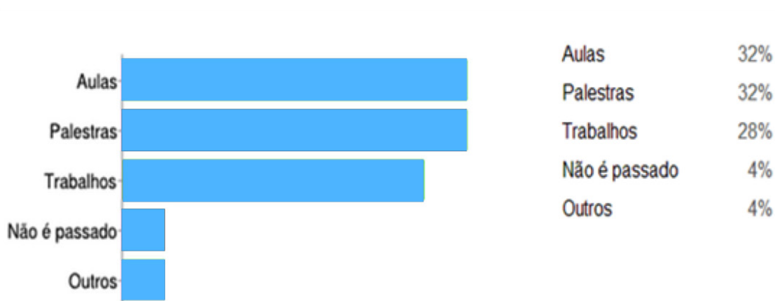
FIGURA 2 : Como o conceito BIM é passado para os alunos.

Além disso, procurou-se saber como o conceito BIM é passado para os alunos, ou seja, quais os métodos utilizados pelo meio acadêmico para abordagem do assunto. E, segundo os educadores entrevistados, 32% relataram que o tema é discutido nas aulas, 32% disse ser por meio de palestras, 28% através de trabalhos, 4% afirmaram que o tema não é passado e outros 4% responderam ser através de outros métodos não mencionados (Figura 2).