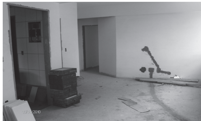
Figura 4 : Alteração no projeto elétrico pelo proprietário.

Essa economia, entretanto, foi diluída nas várias alterações ocorridas durante todo esse processo, provocando um desgaste desnecessário que poderia ter sido evitado caso, todos os projetos tivessem sido discutidos e analisados previamente antes do início da obra. Conforme pode ser apurado, os contratos de venda das unidades permitiam alterações nas mesmas, pelos futuros compradores, provocando intervenções de toda ordem em várias unidades, gerando custos adicionais não previstos (FIG3 e FIG4).