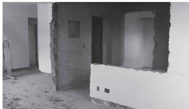
Figura 3 : Alteração do projeto original pelo proprietário.

Solicitações de novas mudanças (leia-se projetos) também ocorreram após a direção da construtora decidir pela troca dos aquecedores de passagem para aquecimento de água, pela instalação de chuveiros elétricos em todos os banheiros das unidades residenciais, alterando significativamente a carga elétrica anteriormente projetada e aprovada (projeto de entrada de energia). Dessa forma, a construtora optou pela economia como um todo, visto que a fiação, a tubulação de água quente (que deixou de existir) e as colunas de alimentação de água fria, para os aquecedores de passagem, foram retirados.