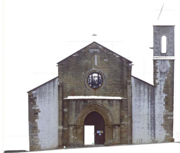
Figura 2 - Levantamento utilizando o varrimento laser 3D (Chastre et al., 2014).