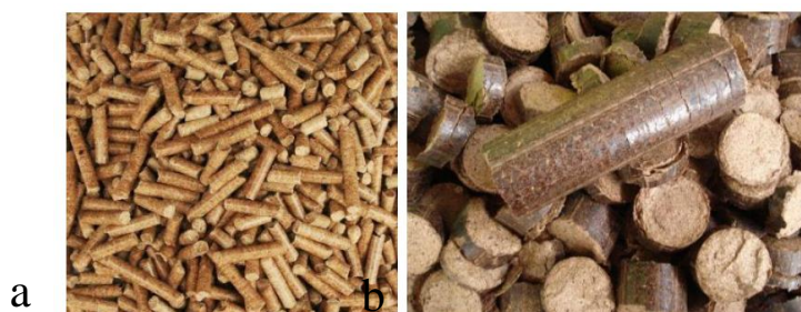
Figura 3. Péletes (a) e Briquetes (b) de biomassa processada.

Os resíduos de madeira podem ser aproveitados para a produção de péletes e briquetes (Figura 3), sendo que os péletes de madeira os granulados possuem dimensões cilíndricas de 6 a 8 milímetros (mm) de diâmetro por 10 a 40 mm de comprimento e os briquetes, possuem medidas superior a 50 mm. Para a produção desses subprodutos, equipamentos de compactação são necessárias, como briquetadeira e peletizadora, de modo a obter produtos com maior densidade (em \text{kg/m}^3 ) e densidade energética (em \text{kcal/m}^3 ) (DIAS et al., 2012; CAVALCANTI e ALVES, 2018).