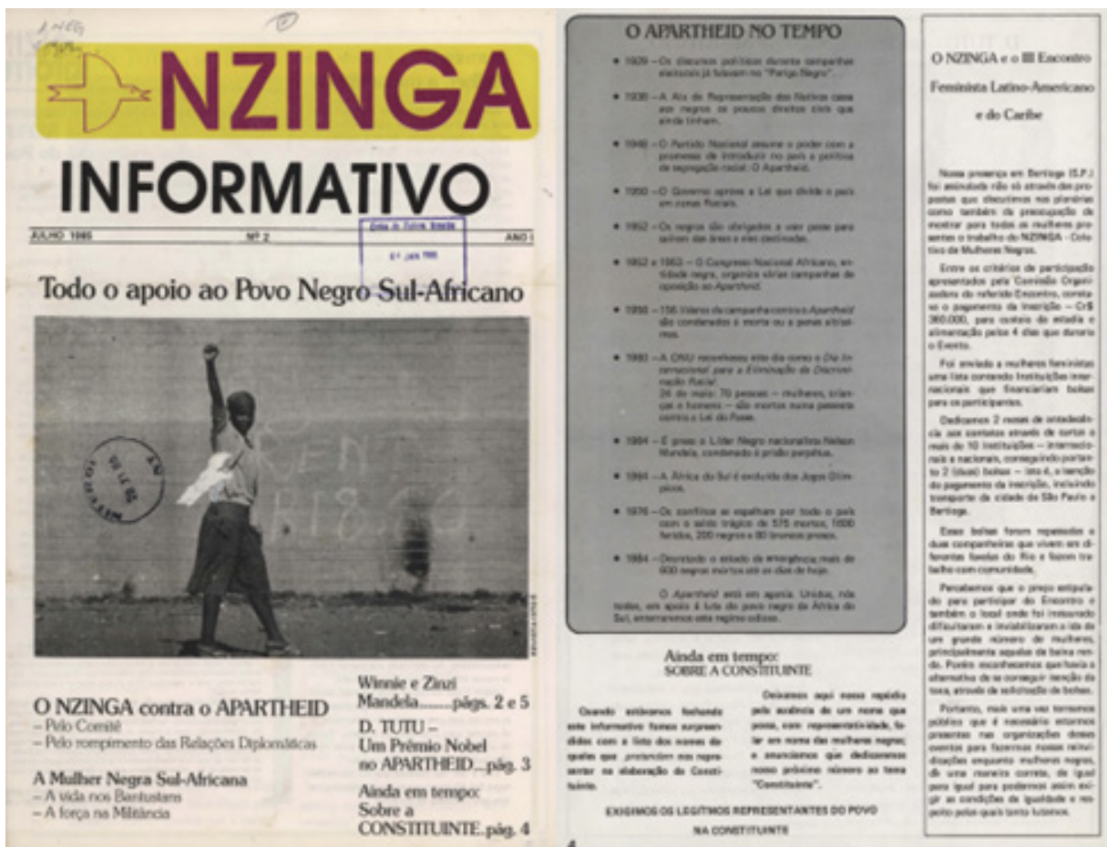
Figura 2 – Capa e pág. 4 da 2ª edição (jul/1985)

A primeira edição foi veiculada em junho de 1985 com quatro páginas e com conteúdo introdutório, de apresentação, informando os leitores sobre o Coletivo de Mulheres Negras Nzinga e quais são os objetivos do novo jornal. As referências à África do Sul podem ser observadas na segunda edição, na qual as mulheres que compõem o coletivo e escrevem para o informativo definem uma edição quase que completa em defesa do povo sul-africano. Circulou em julho de 1985.