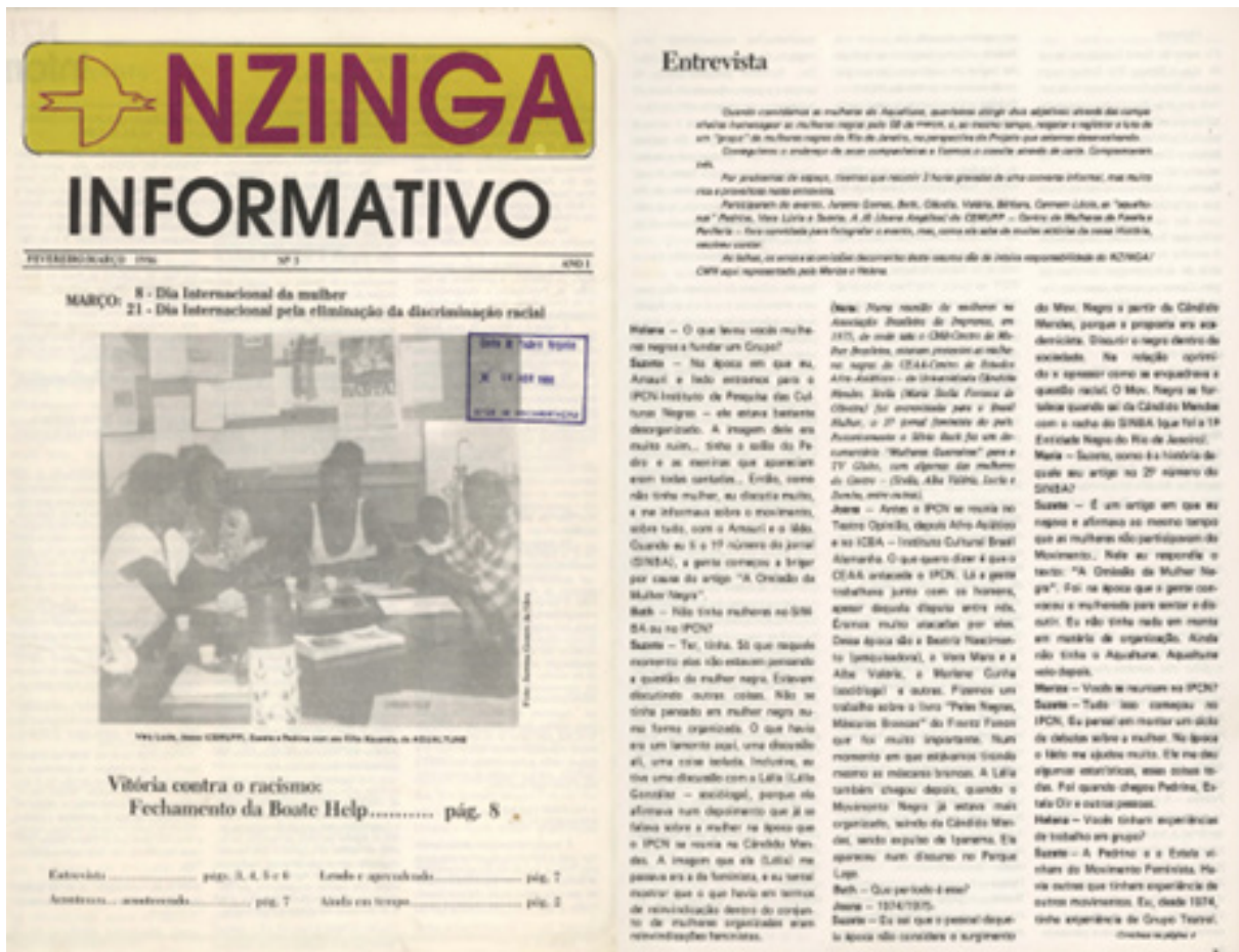
Figura 3 – Capa e pág.3 da 3ª edição (1986)