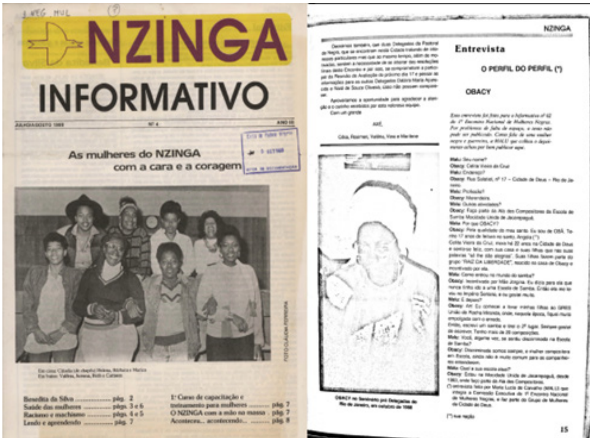
Figura 4 – Capa da 4ª edição (1988) e pág. 15 da 5ª edição (1989)