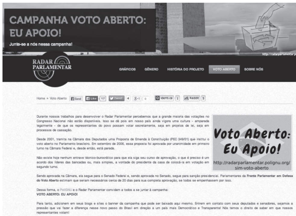
FIGURA 1 – Aplicativo Radar parlamentar.