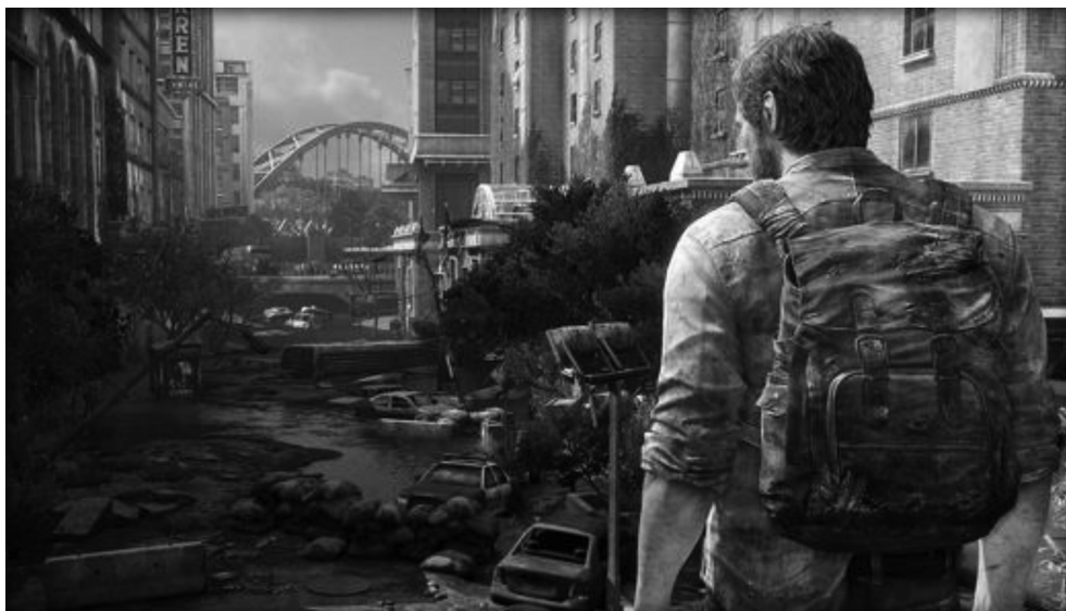
FIGURA 1 – Interface gráfica do jogo Last of us .

O jogo é uma experiência em terceira pessoa, em que o jogador vê o personagem de costas e o comanda pelos caminhos propostos pela narrativa. A imagem a seguir mostra a interface do game: