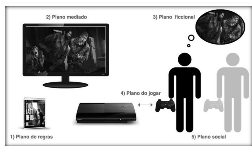
FIGURA 3 – Relação entre o jogo e o jogador na ideia de cinco planos de Michael Nitsche Fonte: Reproduzido com base em Nitsche (2008, p. 15)

Partindo dessas considerações, trazemos à discussão a imagem a seguir que, de certa maneira, sintetiza a ideia de cinco planos proposta por Nitsche (2008):