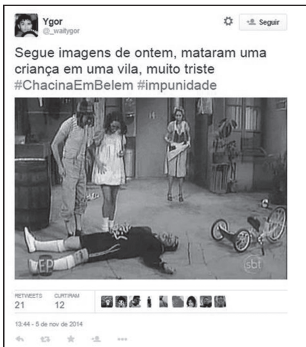
Figura 3 – Humor e chacina: PrintScreen do tweet do usuário @_waitygor: “Segue imagens de ontem, mataram uma criança numa vila, muito triste #ChacinaEmBelem #impuniade”.

A internauta usou o humor para twittar sobre a chacina, apresentando personagens do programa Chaves, conforme Figura 3 – Humor e chacina.