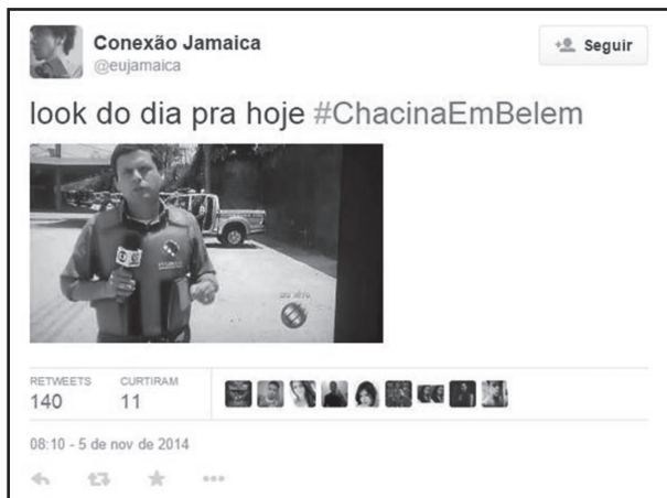
Figura 2 – Humor na rede: PrintScreen do tweet do usuário @eujamaica “look do dia para hoje #ChacinaEmBelem”

O tweet do usuário @eujamaica teve 140 retwittes . Constatou-se, também, o tom irônico e cômico, ao mesmo tempo, com que o usuário se refere à chacina. A expressão “ look do dia ” é usada para demonstrar a roupa que alguém está usando em determinado momento. Nesse caso, a usuária a usa em tom irônico: o colete à prova de balas que o repórter da TV Liberal, afiliada da Rede Globo, está usando para “tranquilizar” a população de que tudo estaria normal nas ruas da cidade.