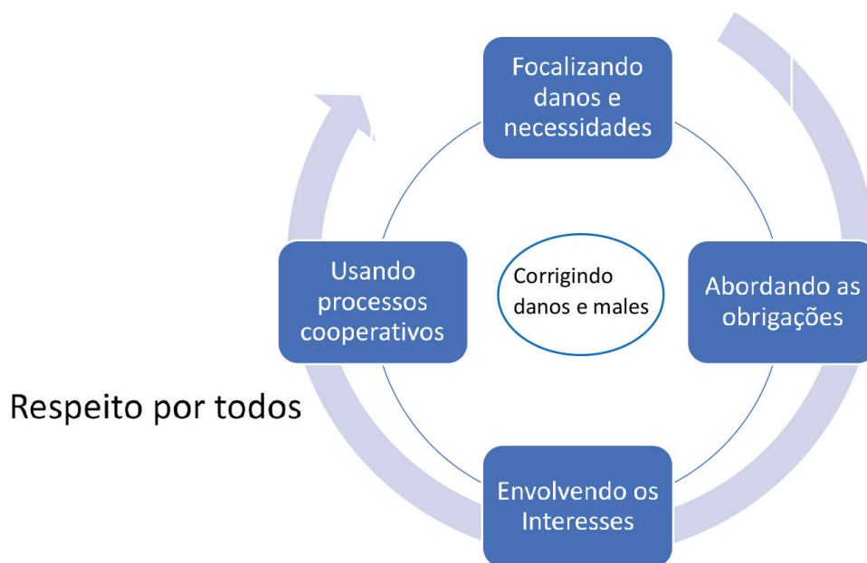
Figura 1 – Justiça restaurativa.

justiça restaurativa sob duas dimensões: a) tratar suas causas, inclusive os fatores negativos que possibilitaram o comportamento ilícito; b) tratar os danos cometidos (ZEHR, 2015, p. 46-48).