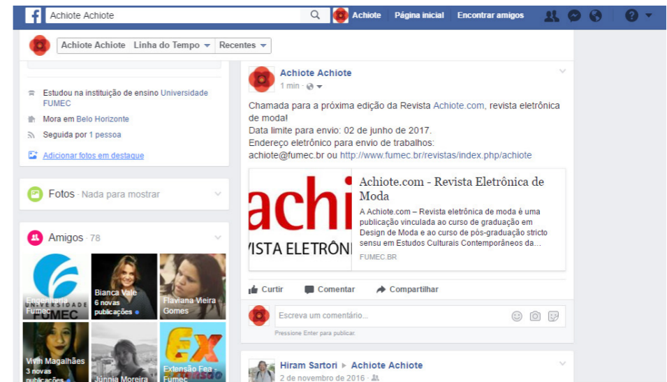
Figura 2 – Facebook da revista Achiote.com