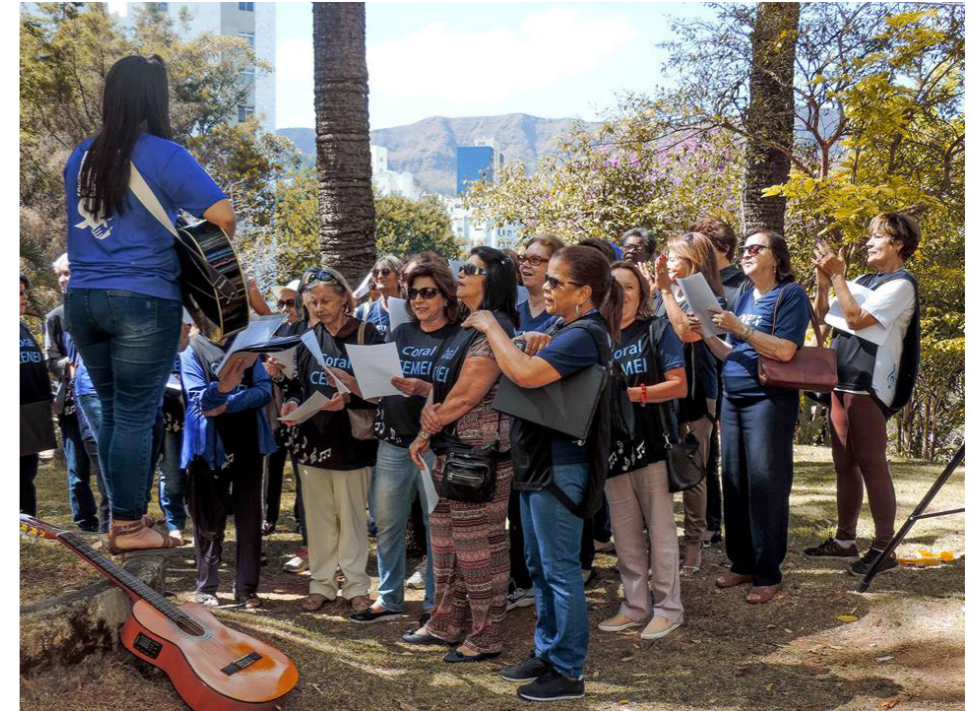
Apresentação do Coral do CEMEI no Dia da Responsabilidade Social (16 de setembro/2017).