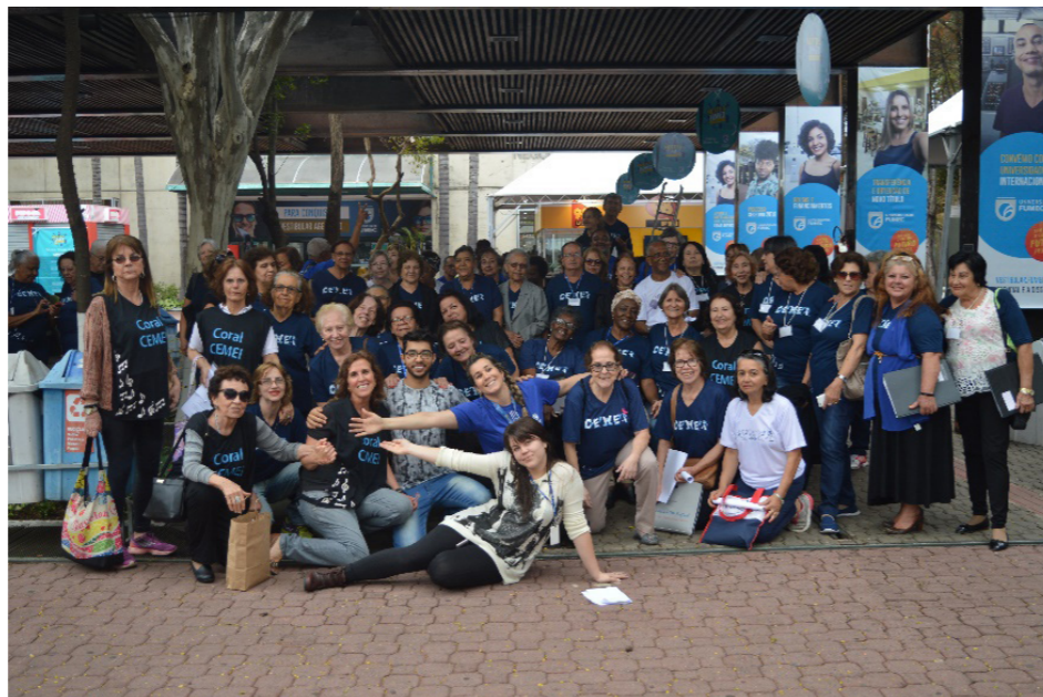
Apresentação do Coral do CEMEI (04 de outubro/2017).