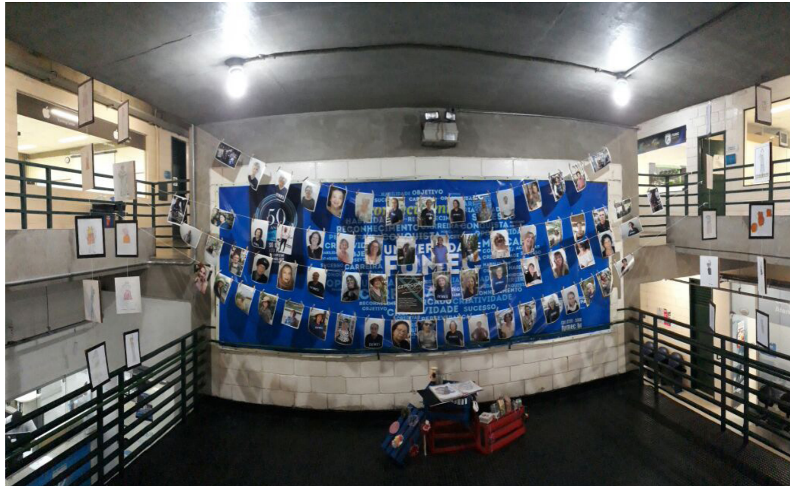
Exposição de trabalhos realizados nas oficinas (Ilustração de Moda, Fotografia e Estética) no hall de entrada da FUMEC/FACE (30 de novembro/2017).