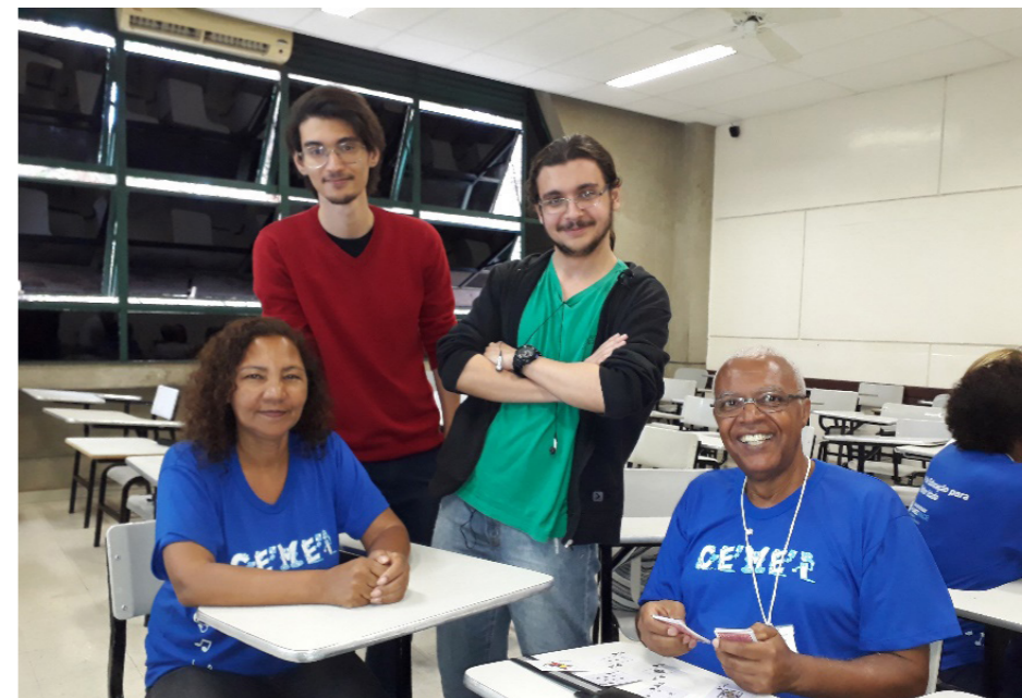
Oficina de Raciocínio Lógico (Novembro 2017).