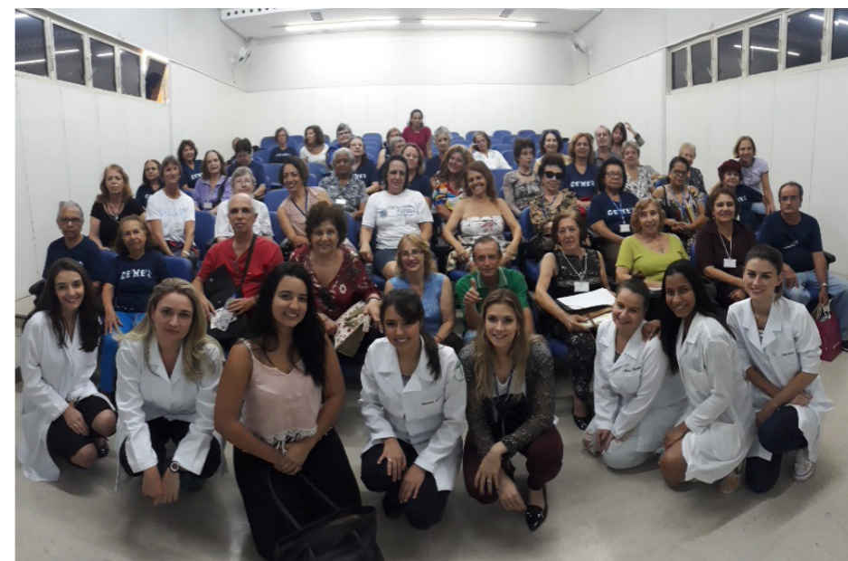
Oficina de Estética e Cuidados com a Pele (Novembro 2017)