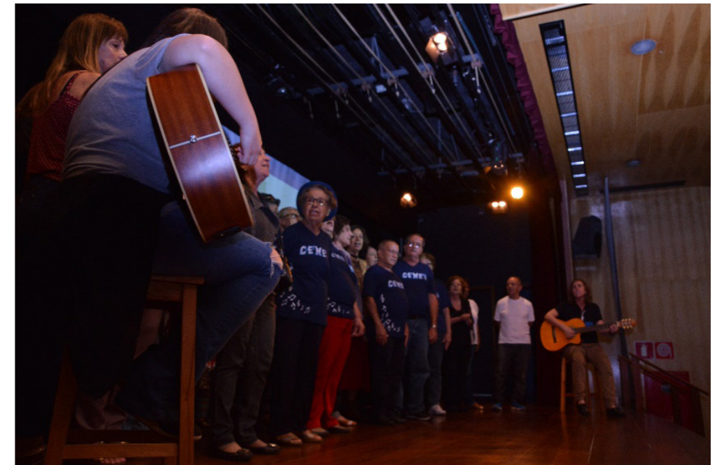
Apresentação do Coral CEMEI no encerramento (01 de dezembro/2017).