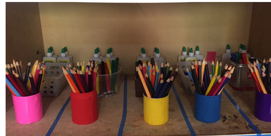
Intervenção: Material no armário de modo acessível para as crianças.