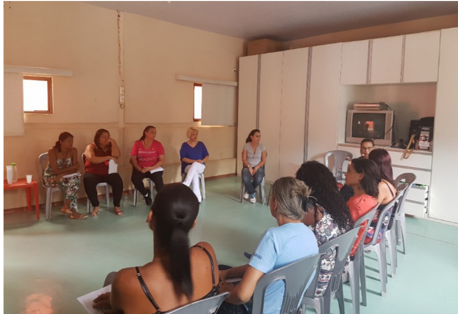
Apresentação do projeto para as equipes pedagógicas das creches parceiras