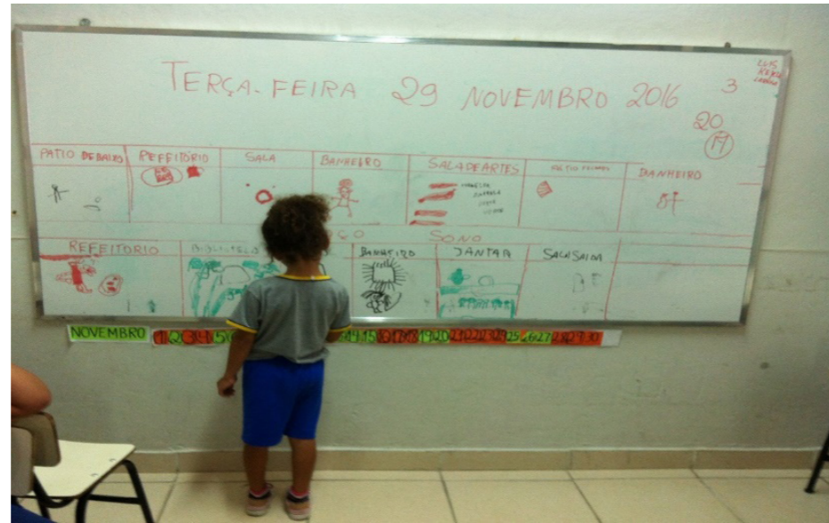
Intervenção: Registro da rotina no quadro e calendário.