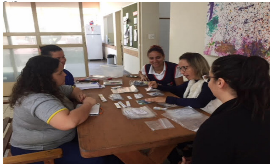
Reunião e observação de prática pedagógica na Escola Balão vermelho: oficina para conhecer os jogos