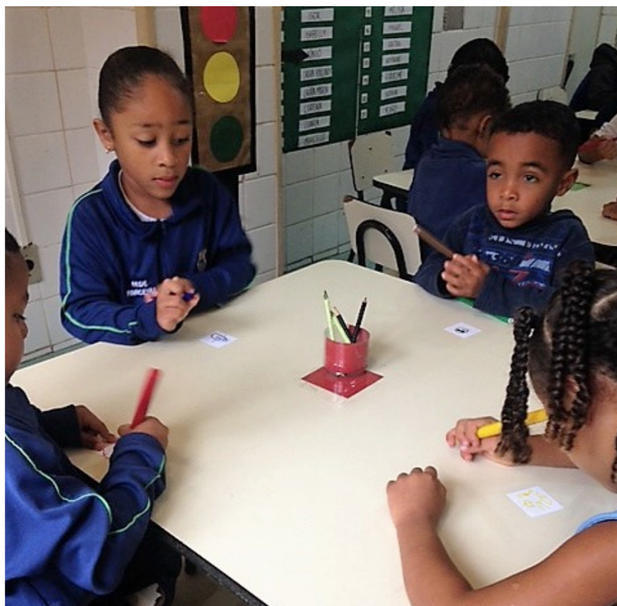
Intervenção: Identificação das mesas e materiais por cores.