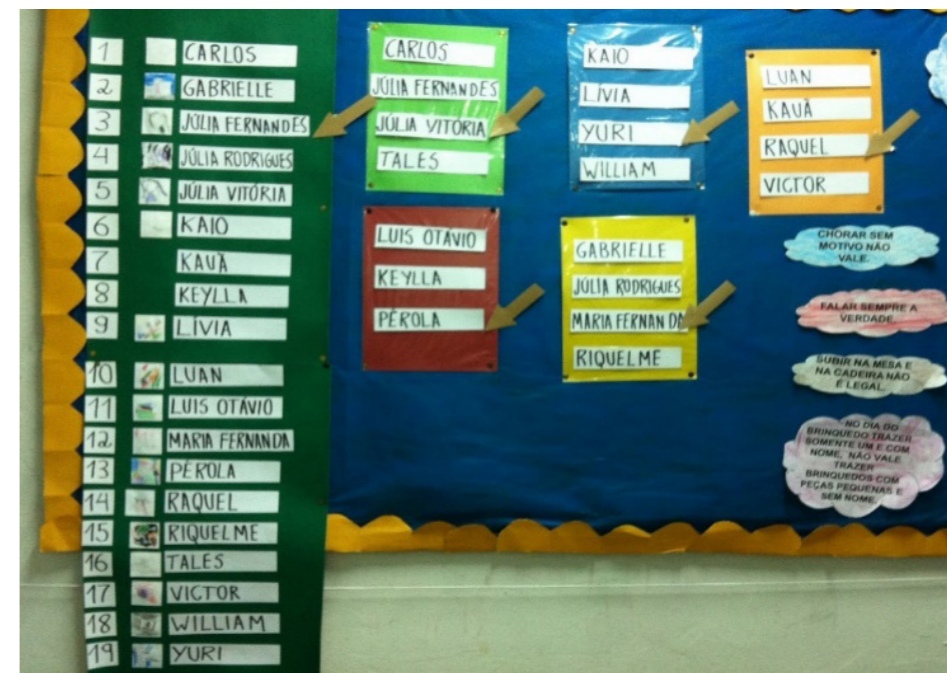
Intervenção: Fichas com os nomes das crianças e setas indicadoras com os ajudantes do dia e da mesa.