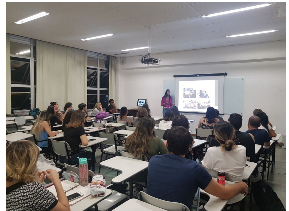
Apresentação final Projeto: Ambiente Educativo no Contexto Escolar da Educação Infantil (2017).