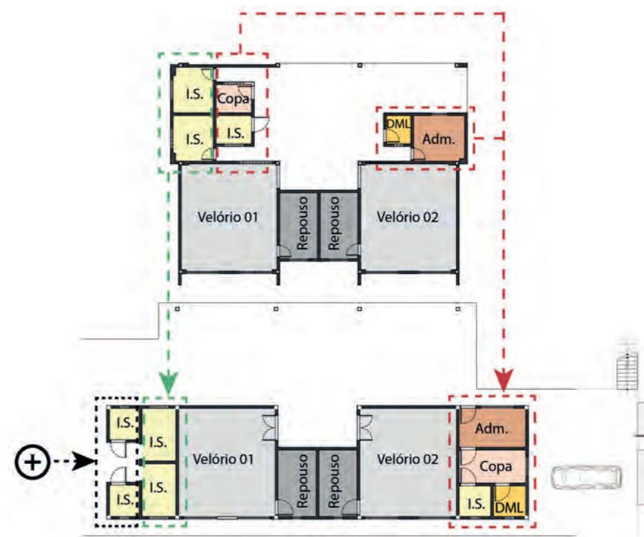
Figura 05: Adaptação do modelo da SETOP para o projeto para Raposos.