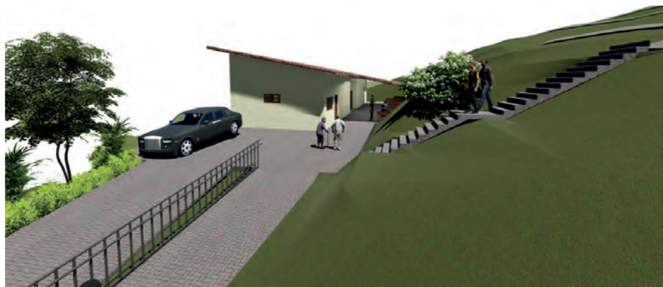
Figura 07: Perspectiva do projeto.