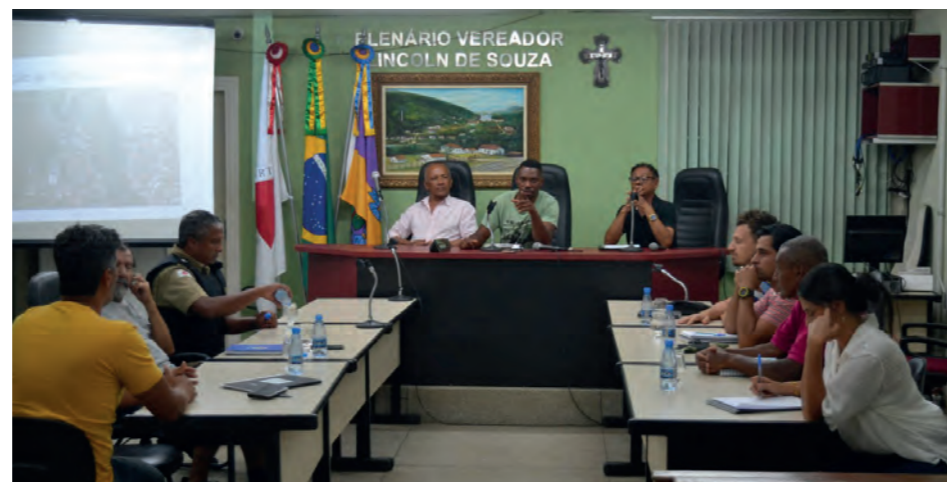
Figura 09: Apresentação do projeto ao CODEMA na Câmara Municipal de Raposos.