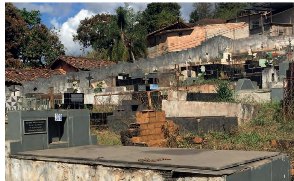
Figura 01: Cemitério Público de Raposos.