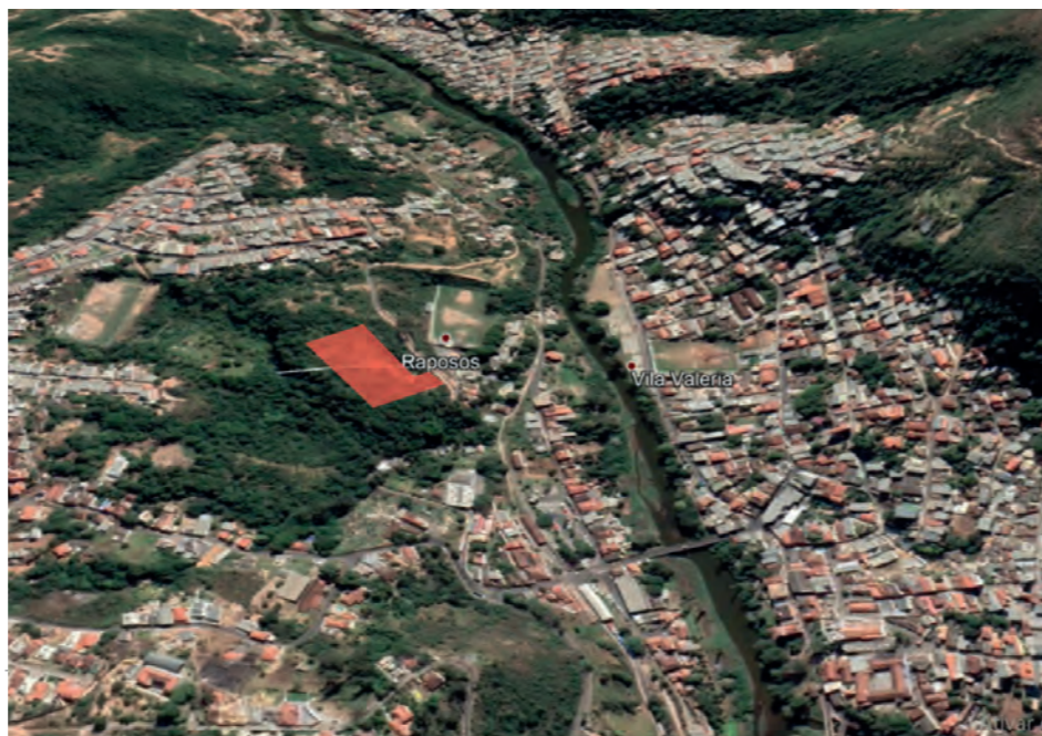
Figura 03: Localização do terreno doado para o município de Raposos.