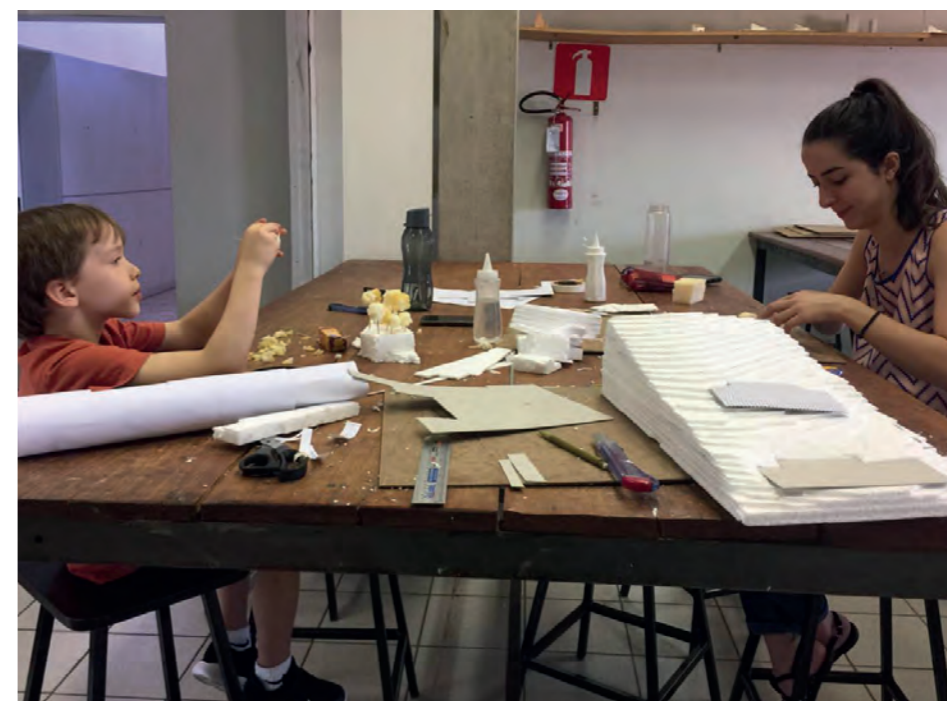
Figura 11: Oficina de maquete no Dia de Responsabilidade Social.