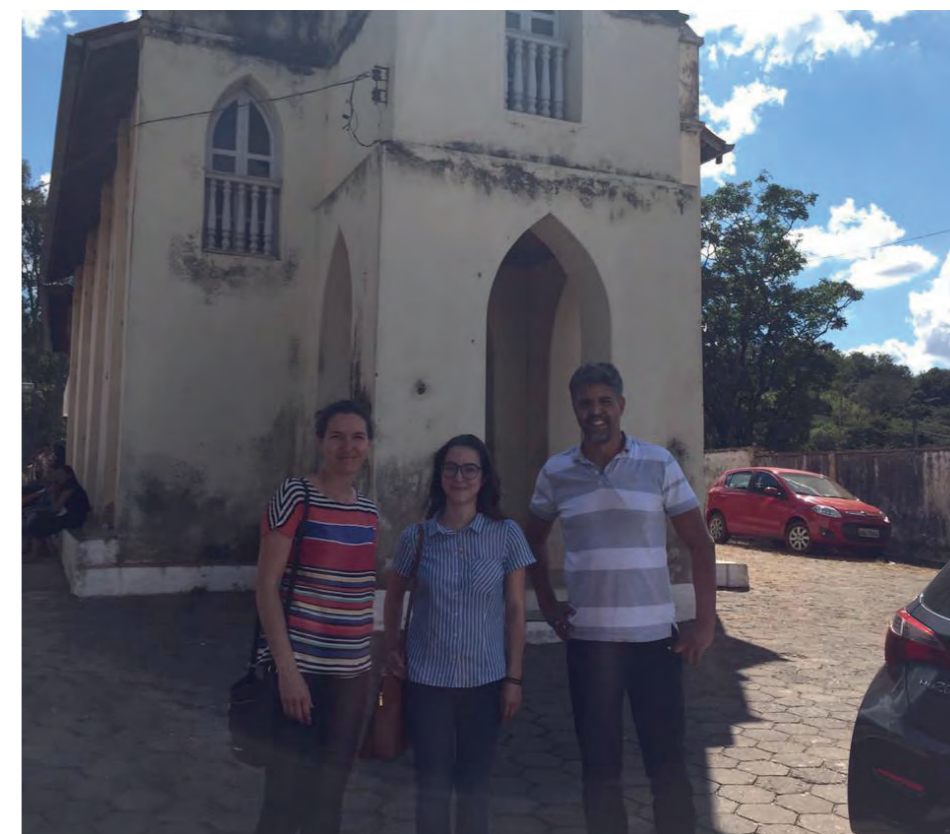
Figura 02: Visita técnica ao Cemitério de Raposos.