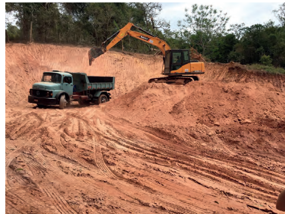
Figura 10: Obras de terraplanagem no terreno de implantação.