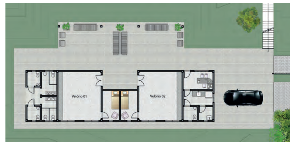
Figura 06: Planta humanizada do velório.